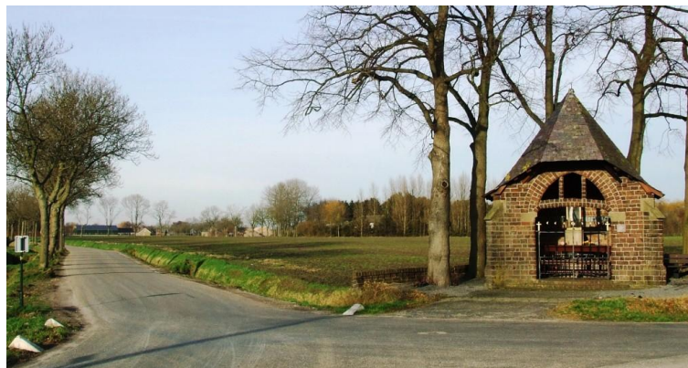
Foto: Kapel in de Spellestraat.

Tip: de Spellestraat wordt gekenmerkt door fraaie boerderijen.